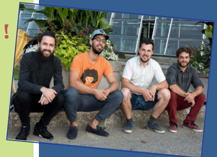
Le saxophoniste Hichem Khalfa s'arrête à Mont-Joli avec son quartet !

Lauréat du Grand prix Festi Jazz 2016, le trompettiste Hichem Khalfa s'arrête à Mont-Joli avec son quartet ! Au menu, des compositions éclectiques et des mélodies fortes, avec en toile de fond des rythmes africains et sonorité orientales !